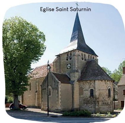
Eglise Saint Saturnin

De plus, l'école du Chautay occupe une place importante dans l'histoire de la commune et est au centre des préoccupations du conseil municipal.