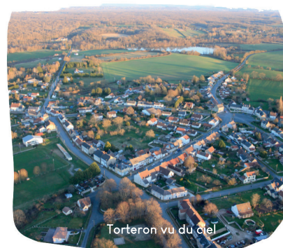
Torteron vu du ciel

C'est ainsi qu'au terme de cette page d'histoire avec l'aide de la Communauté de Communes et le travail du conseil municipal, la commune de Torteron continuera de se tourner vers l'avenir en finalisant de nombreux projets structurants.