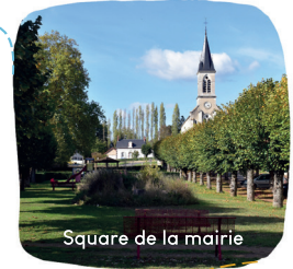
Square de la mairie