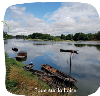
Toue sur la Loire