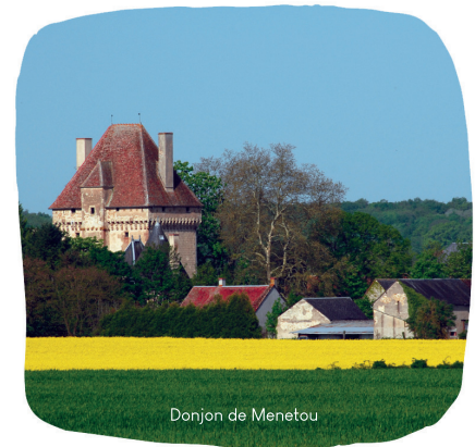
Donjon de Menetou

Si vous passez par Menetou-Couture, à pied, en voiture ou à vélo, n'oubliez pas d'emprunter nos sentiers pédestres, ou de vous y arrêter pour visiter le donjon, l'abbaye de Fontmorigny ou l'église saint-Caprais. Vous y serez toujours les bienvenus.