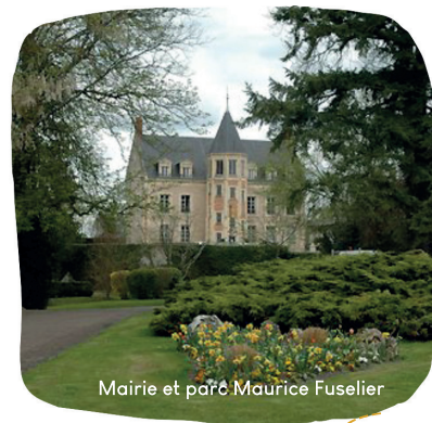
Mairie et parc Maurice Fuselier

Au chapitre des projets le canal de Berry qui subira de nombreux travaux à partir de la fin 2023 dans le cadre de l'aménagement de sa partie cyclable par le Syndicat du Canal de Berry (SCB) ; la réalisation d'une chaufferie bois en bordure du centre-ville et dans le cadre des Petites villes de demain.