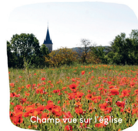
Champ vue sur l'église