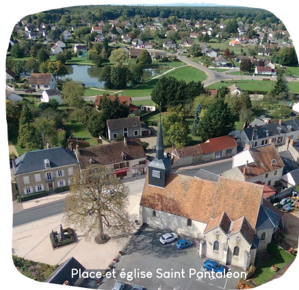
Place et église Saint Pantaléon

Tout en étant tournée vers l'avenir, Cours-les-Barres a su garder le charme d'une commune rurale en ayant les avantages de la proximité de villes moyennes.