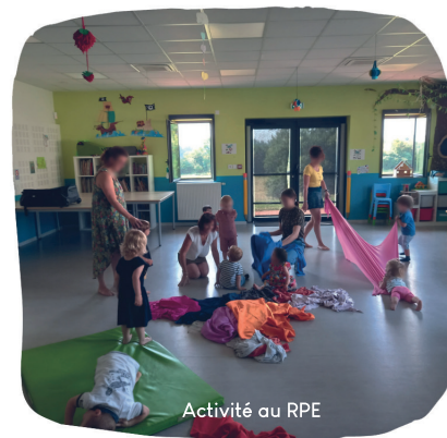
Activité au RPE