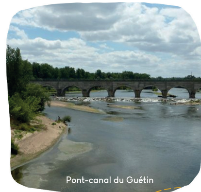
Pont-canal du Guétin

Cuffy au fil de son histoire, au fil de l'eau, au fil de sa biodiversité, au fil de ses fleuves, au fil de ses parcours pédestres, au fil de sa véloroute, au fil de son cadre de vie, et tout simplement Cuffy au fil de vos envies vous attend !