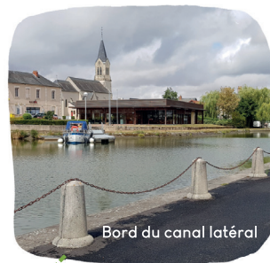
Bord du canal latéral

Intégrée à la Communauté de Communes des Portes du Berry Entre Loire et Val d'Aubois, cela permet à ses habitants de bénéficier des infrastructures mutualisées telles que l'accueil de loisirs, la médiathèque, la maison de santé mais également de nombreux services.