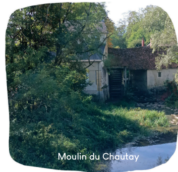
Moulin du Chautay